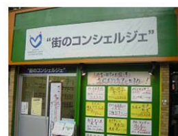
街のコンシェルジュ

「街のコンシェルジュ」事業等の取組みは、 経済産業省・中小企業庁の『がんばる商店街77選』(平成18年)に選ばれています。