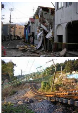
▲ 新潟県中越地震の様子

中小企業にとってBCPの策定は、自然災害や大火災等の緊急事態において事業中断を最短にとどめ被害を最小化するための企業の危機管理の新技术として緊急時の企業存続のみならず、平常時の企業価値向上に大変有意義なものです。是非、ご参加下さい。